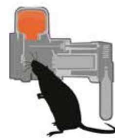
1. Rotten tiltrækkes af madding