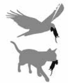
4. Rov- eller husdyr kan nu hapse den giftfrie rotte