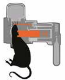
2. CO 2 -patronen skyder et stempel ned i hovedet på rotten