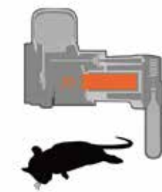
3. Rotten falder til jorden, og fælden kan bruges yderligere 23 gange