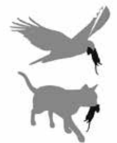
4. Rov- eller husdyr kan nu hapse den giftfrie rotte