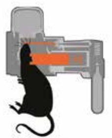
2. CO2-patronen skyder et stempel ned i hovedet på rotten