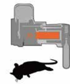
3. Rotten falder til jorden, og fælden kan bruges yderligere 23 gange